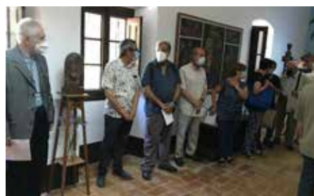
Inauguració Sala Josep M Nuet.