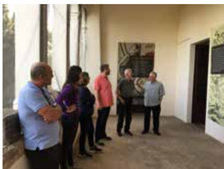
Patronat de la Fundació Catalunya-Amèrica.