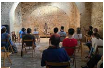
Recital de poesia, festa de Sant Ramon.